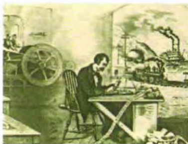
Четыре крупнейших изобретения, приведшие к индустриальной революции

Обе революции относятся к так называемым технологическим .