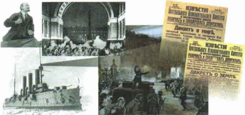
Октябрьская революция в России. 1917 г.

Революция может касаться одного или нескольких обществ в данный период времени. Революции бывают кратковременными и долговременными .