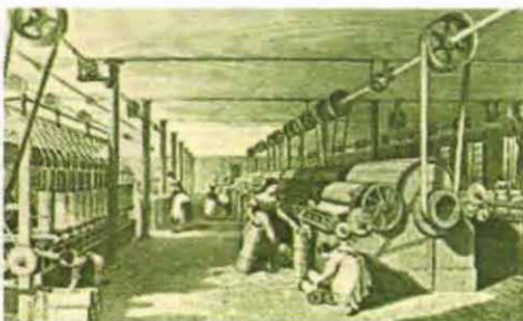
Текстильная отрасль — локомотив индустриальной революции

Глобальные революции затрагивают все сферы общества и множество стран, поэтому требуют долгого времени. Однако они всегда приводят к качественному изменению общества.